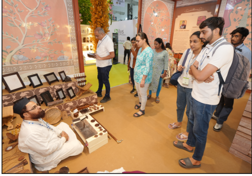
தனித்துவமான சோர்ஸிங் தீர்வுகளை இந்தியன் ஹெரிடேஜ் வழங்குகிறது.

வாங்குபவர்கள், சமகால வர்த்தகச் சூழலுக்கு ஏற்ற மெர்சண்டைசிங் தீர்வுகள் மற்றும் தனித்துவமான டிசைன் மொழியை இங்கு கண்டறியலாம். இன்றைய ரீடெயில், திட்ட மற்றும் கிஃப்டிங் சந்தைகளுக்கான