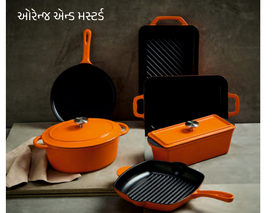
ઓરેન્જ એન્ડ મસ્ટર્ડ