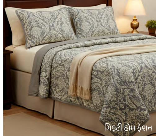
ગિફ્ટી હોમ ફેશન