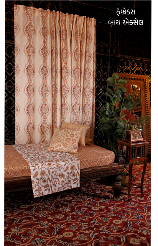
ફેબ્રેક્સ બાથ એક્સેલ

શ્રેણીની ગહનતા મહત્વપૂર્ણ છે, કારણ કે આજના ખરીદદારો હવે માત્ર પ્રોડક્ટ્સમાં સોર્સિંગ કરી રહ્યા નથી. તેઓ વ્યાપક જીવનશૈલીની ગાથાઓ, તીવ્ર શ્રેણી સંલગ્નતા અને વધુ સંપૂર્ણ મર્યાદાઈઝિંગ ઉકેલોનું નિર્માણ કરી રહ્યા છે. ■