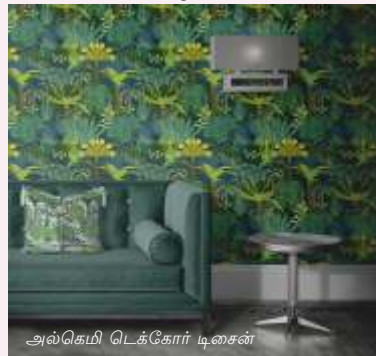
அல்கெமி டெக்கோர் டிசைன்

ஹால் 2ல் உள்ள 120க்கும் மேற்பட்ட கண்காட்சியாளர்கள், கைவினைப் பொருட்கள், கையால் செய்யப்பட்ட சாதனங்கள், கடைகாரங்கள் மற்றும் சுவரோவியங்கள் போன்ற சுவர் அலங்காரம், மேஜை அலங்காரம், அலங்காரத் தரை, கதவு விரிப்புகள், தரை அலங்காரம், தென்னை நார் மற்றும் சணல் போன்ற விரிவான இந்திய மற்றும் சர்வதேச வீட்டு அலங்கார தீர்வுகளை வழங்குவார்கள். தயாரிப்புகள், அலங்கார விளக்குகள், மெழுகுவர்த்திகள், மெழுகுவர்த்திகள், நறுமண எண்ணெய்கள், பாட்பெளி, தோட்டக்காரர்கள், குவளைகள், சிலைகள், செயற்கை பூக்கள் மற்றும் தாவரங்கள், வாசனை திரவியங்கள், நறுமண எண்ணெய்கள், ஓவியங்கள் மற்றும் கலை, சிற்பங்கள் மற்றும் சிறிய பேசும்