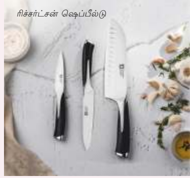
மற்றும் மதிப்பை வழங்குகின்றன.

Richardson Sheffield என்பது 1839 ஆம் ஆண்டு முதல் உலகளாவிய கத்தி சந்தையை வடிவமைக்கும் ஒரு பிரிட்டிஷ் பிராண்ட் ஆகும். இதன் நோக்கம் அழகான, உயர்தர வடிவமைப்பை அனைவருக்கும் அணுகக்கூடியதாகவும், மலிவு விலையிலும் உருவாக்குவதாகும். பிராண்டின் வடிவமைப்புகள் அணுகக்கூடிய ஸ்டார்டர் செட்கள் முதல் தொழில்முறை சமையல்கருக்களை உயர்மட்ட கத்திகள் வரை - ஒவ்வொரு மட்டத்திலும் உயர்ந்த தரம்