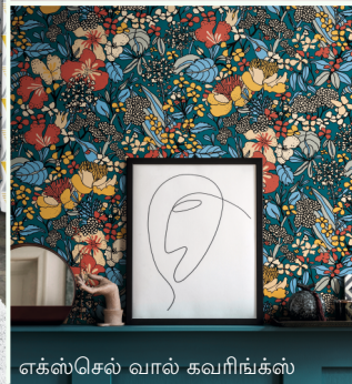
எக்ஸ்செல் வால் கவரிங்க்ஸ்