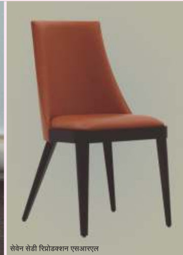
सेवेन सेडी रिप्रोडक्शन एसआरएल