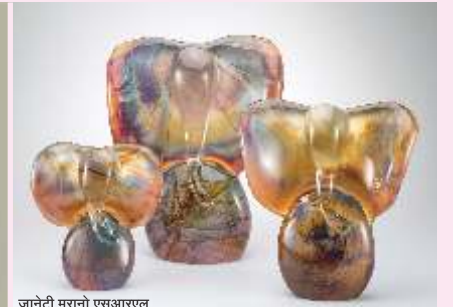
जानेटी मुरानो एसआरएल