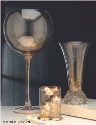
ए कासा के.एस.ए.एस.

इटैलियन नेशनल पैवेलियन में भाग लेने वाली इटैलियन कंपनियाँ हैं (उल्लेख करते हुए नीचे दी गई कंपनियों के प्रोडक्ट के फोटोज लगाएँ):