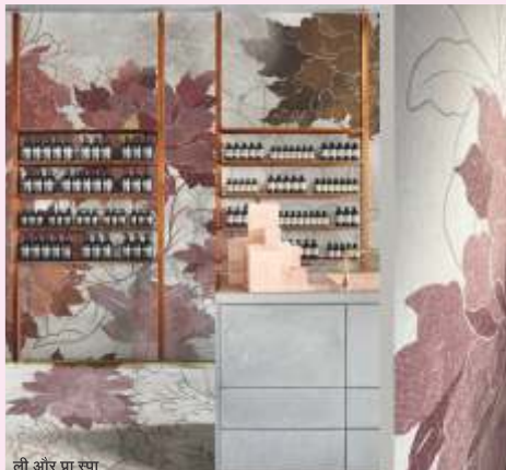
ली और प्रा स्या