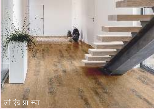
ली एंड प्रा स्पा

आप एचजीएच इंडिया में ग्रीनलैम (भारत) और ली एंड प्रा एस.पी.ए. (इटली) की वुडेन और लैमिनेटेड फ्लोरिंग पा सकते हैं। एटीएम एंटरप्राइजेज अपने खुद के ब्रांड नाम, डिजाइनर फ्लोरिंग के तहत विभिन्न प्रकार के इंपोर्टेड वुडन और लैमिनेटेड और फ्लोरिंग का एकजीबिशन करेंगे। मैट फोर और कॉयल क्राफ्ट कॉयल से बने डोर