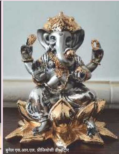
बुनेल एस.आर.एल. प्रीजियोसी डीऑटोर