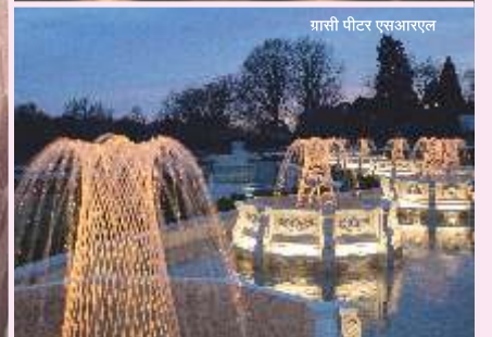
गासी पीटर एसआरएल