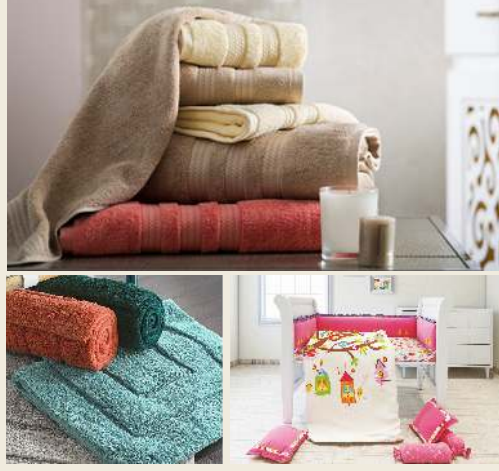
डिजाइन तथा गुणवत्ता के लिए विख्यात अनेक निर्यातक पहली बार भारतीय बाजार के लिए अपनी रेंज को पेश करेंगे।

यूएसए तथा यूरोप जैसे परिष्कृत अंतरराष्ट्रीय बाजारों में अपनी