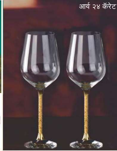
आर्य २४ कॅरेट

उत्पादने हा एचजीएच इंडियातील उत्पादनांचा महत्त्वाचा भाग आहे. याआधीही हे स्पष्ट करण्यात आले आहे की एचजीएच भावनिक गिफ्ट बाजारपेठेवर भर देते, जाहिरातबाजीवर नाही. मोठ्या कॉर्पोरेट गिफ्ट बायर्सना व्यापक पर्याय देणाऱ्या या प्रदर्शनात, भेट घेणाऱ्याच्या भावनांचा विचार करून गिफ्ट पॅक्स आणि भेट देण्याजोग्या वस्तू हव्या असणाऱ्या गिफ्ट ट्रेडर्स, होलसेलर्स आणि रीटेलर्ससाठी पुरवठादारही उपलब्ध आहेत.