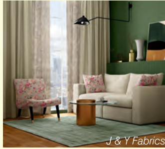
J & Y Fabrics

இந்திய நுகர்வோர் தங்கள் வீடுகளை அதிக ஆர்வத்துடனும் ஆற்றலுடனும், தேர்ந்தெடுத்தும், வசதி மற்றும் ஆறுதல் ஆகிய அம்சங்களிலும் மேம்படுத்தி வருகின்றனர் வீடு என்பது ஒரு நீடித்த மெகாட்ரென்ட் ஆகும் இது தொற்றுநோய்க்குப்பின் தற்போது ஒரு ஊக்கமுட்டலை அனுபவிக்கிறது. வீட்டு ஜவுளி, வீட்டு அலங்காரம், வீட்டுப் பொருட்கள், சில்லறை அளவில் பரிசுகள் ஆகியவற்றுக்கான தேவையின் செங்குத்தான உயர்வு, தற்போதைய வீட்டுத் தயாரிப்பு விரிப்பதேர்வுகளுக்கான ஒரு நிஜ உலக சாட்சியம் சுவாரஸ்யமாக, எச்ஜிஹெச் இந்தியாவின் சில்லறை விற்பனையாளர்கள், பிராண்டுகள் மற்றும் இந்தியா முழுவதும் உற்பத்தியாளர்களுடனான கருத்துப் பரிமாற்றம் உணர்த்துவதன் படி நாம் நீண்ட கால வாய்ப்புகளும்