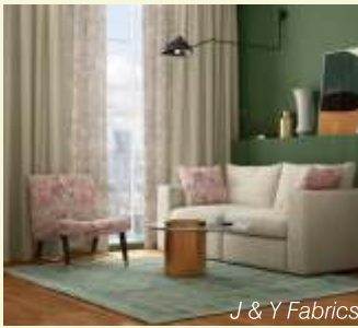
J & Y Fabrics

ഇന്ത്യൻ ഉപഭോക്താക്കൾ തങ്ങളുടെ വീടുകൾ രൂപത്തിലും സകര്യത്തിലും ഉയർന്ന താൽപ്പര്യത്തോടെയും ഉൾജ്ഞോടെയും നവീകരിക്കുന്നു. വീട് എന്നും നമ്മുടെ സ്വപ്നമാണ്, ഇപ്പോൾ നിലവിൽ പോസ്റ്റ്പാൻഡെമിക് ബുസ്റ്റ് ആസ്വദിക്കുന്നു. ഗാർഹിക തൂണിത്തരങ്ങൾ, ഗൃഹാലങ്കാരങ്ങൾ, വീട്ടുപകരണങ്ങൾ, ചില്ലറ വിൽപ്പന തലത്തിലുള്ള സമ്മാനങ്ങൾ എന്നിവയുടെ ഡിമാൻഡ് കൂത്തനെ ഉയർന്നത് നിലവിലെ ഗാർഹിക ഉൽപ്പന്ന മുൻഗണനകളുടെ യഥാർത്ഥ ലോക സാക്ഷ്യമാണ്. ഇന്ത്യയിലുടനീളമുള്ള റീട്ടെയിലർമാർ, ബ്രാൻഡുകൾ, നിർമ്മാതാക്കൾ എന്നിവരായുള്ള എച്ച്.ജി.എച്ച്. ഇന്ത്യ ടീമിന്റെ ഇടപെടൽ അനുസരിച്ച്, ദീർഘകാല സാധ്യതകളും പ്രതീക്ഷ നൽകുന്നതാണ്.